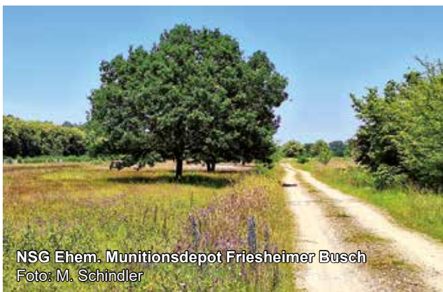
NSG Ehem. Munitionsdepot Friesheimer Busch