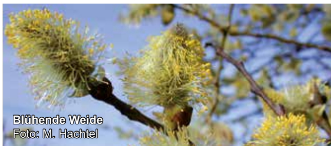
Blühende Weide

Biologische Station Bonn/Rhein-Erft e.V.