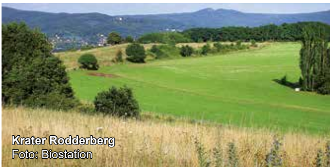
Krater Rodderberg

Anmeldung erforderlich bei der VHS Bonn unter www.vhs-bonn.de/programm