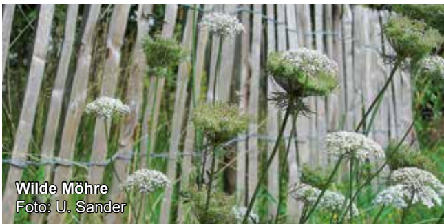
Wilde Möhre

Bitte Handschuhe und Trinkwasser mitbringen. Anmeldung erbeten an meisterpeter@hotmail.com.