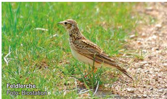
Feldlerche