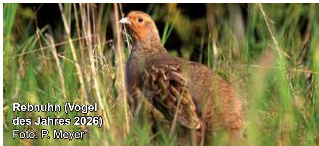
Rebhuhn (Vogel des Jahres 2026)

5 €, für Familien 10 €. Anmeldung erforderlich unter www.biostation-bonn-rheinerft.de/events . Feste Schuhe empfohlen.